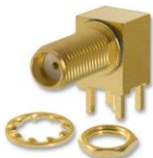
SMA-KWE-L13.2 (длинная резьба)