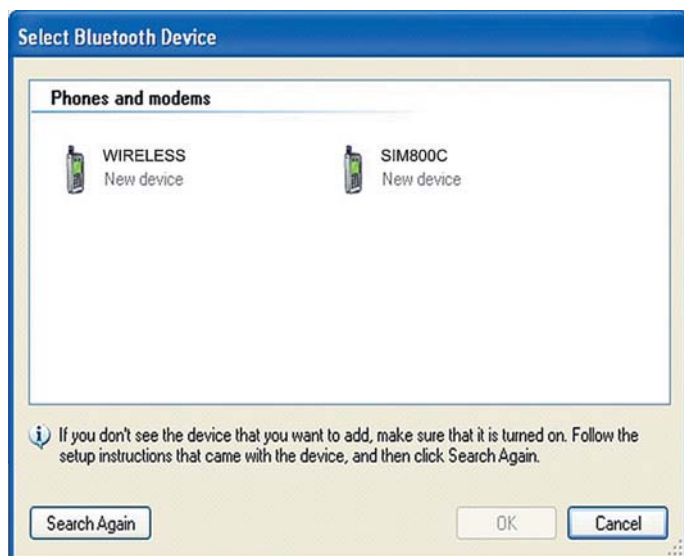
Рис. 2. Найденные Bluetooth-устройства

AT+BTSPPCFG // команда активирует добавление новой записи `TT` и имени входа в строку ответа на запрос Пример: AT+BTSPPCFG=TT,2 //настройка режима запроса TT +BTSPPCFG: TT,1 OK