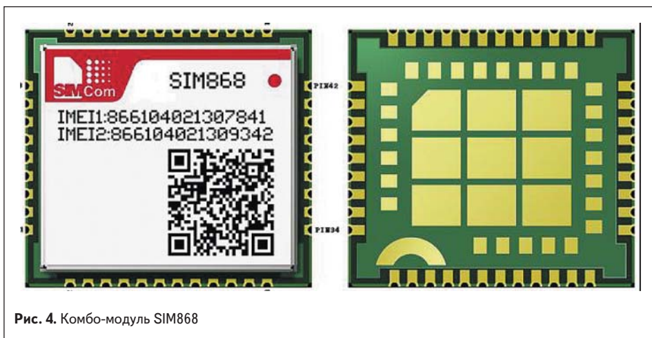
Рис. 4. Комбо-модуль SIM868

плату. Каждый из указанных компонентов отладочного комплекта можно приобрести отдельно.